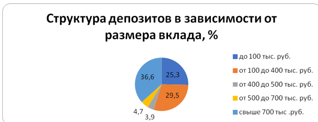
Рис. 1. Название рисунка